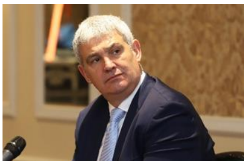
Пламен ДИМИТРОВ Вицепрезидент на ИСС и член на ЕИСК (Група II)

Пламен Димитров има 30-годишен опит в сферата на икономическата и социална политика на национално и международно ниво. Президент е на Конфедерацията на независимите синдикати в България, титулярен член на Управителния съвет на Международната Организация на Труда, член на Европейския икономически и социален съвет, първи заместник-член на Генералния Съвет на Международната конфедерация на профсъюзите, председател на Комитета за човешки и синдикални права към Международната Конфедерация на профсъюзите, член на Изпълнителния комитет на Европейската конфедерация на профсъюзите, заместник-член на Управителния съвет на Европейския орган по труда, член на Изпълнителния комитет на Паневропейския регионален съвет към МКП, член на Националния съвет за тристранно сътрудничество, заместник-председател на Икономическия и социален съвет. Доктор по Икономика и организация на труда в УНСС, София.