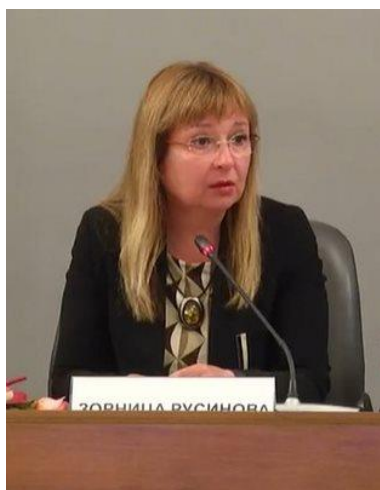
Зорница Русинова Председател на Икономически и социален съвет на Република България

Зорница Русинова е председател на Икономическия и социален съвет на Република България. В периода 2012 г. и 2020 г. е заместник-министър на труда и социалната политика в три правителства и министър на труда и социалната политика в периода 2016 – 2017. Отговаряла е за политиките на пазара на труда, социалното включване, трудово право, европейските въпроси и международното сътрудничество и за управлението на европейските фондове. Заемала е ръководни позиции в Министерство на труда и социалната политика и в Министерство на държавната администрация и административната реформа. Успешно е ръководила международни проекти на Американската агенция за международно развитие, на