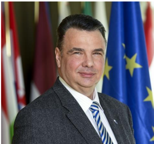
Аурел Лауренциу ПЛОШЧАНУ Заместник-председателя на Европейския икономически и социален комитет, отговарящ за комуникацията

Аурел Лауренциу Плошчану е член на Европейския икономически и социален комитет (ЕИСК) и от група на работодателите от 2007 г. Плошчану е участвал в дейности във всички секции на ЕИСК. Преди да бъде избран за заместник-председател по комуникацията през 2023 г., той е бил председател на специализирана секция „Заетост, социални въпроси и гражданство“ (SOC) на ЕИСК, съпредседател на Съвместния консултативен комитет ЕС-Сърбия (2020-2023 г.) и президент на Одитния комитет от 2015-2017г.