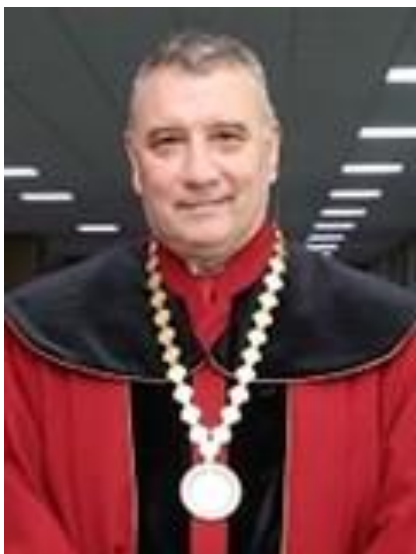
□ проф. д-р Димитър ДИМИТРОВ ректор на Университета за национално и световно стопанство

Проф. д-р Димитър Димитров е български учен-икономист в сферата на отбранителната икономика и сигурността. Завършва ВИИ "К. Маркс" - София (1983-1988) г. със специалност "Икономика и управление на промишлеността". Ректор на Университета за национално и световно стопанство от декември 2019 г. Проф. Димитров е бил декан на факултет "Икономика на инфраструктурата" на УНСС в периода ноември 2015-ноември 2019 г. Ръководител е на катедра "Национална и регионална сигурност" от 2007 г.